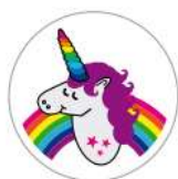
Nr kat. 160-100-46 2 arkusze = 20 sztuk